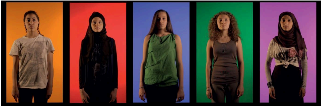
Fíor. 1 Teilgean fiormhéid de thaifead na gcóiréagrafaíochtaí rince, 'Songs for Edgware Road, Radharc an suiteáin ag St Marylebone Parish Church, crypt, RE-ASSEMBLY exhibition 2011-2013, (18 Aibreán- 21 Aibreán 2013)