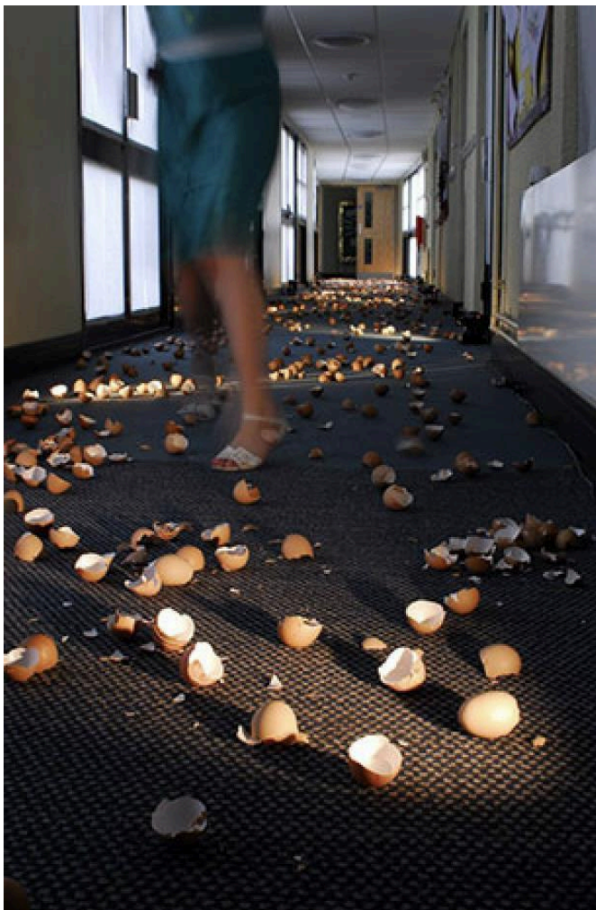
Fíor 6, Walking on Eggshells , saothar a forbraíodh leis an bhfoireann

Agus sinn ag tabhairt athchuid ar 'The Enchantment of Modern Life, Attachments, Crossings and Ethics' , tá caibidil iomlán ag an údar Jane Bennett maidir le meiteachlaoclú agus ainmhithe hibrideacha agus an tionchar draíochtúil a bhíonn acu. Feiceann sí na hainmhithe aistritheacha seo mar léirithe ar an tsaoirse agus ar an acmhainneacht, tréithe a ghintear trí bhraistint soghluaisteachta coirp: