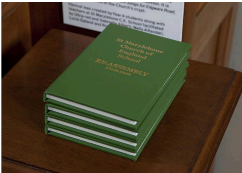
Fíor. 2 Leabhar iomann, radharc suiteáin Songs for Edgware Road, Radharc suiteáin ag Séipéal Paróiste Naomh Marylebone, uaimh, RE-ASSEMBLY exhibition 2011-2013 (18 Aibreán - 21 Aibreán 2013)