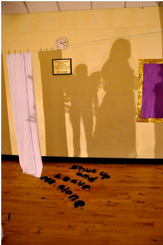
Fíor 7. An 'Airing Cupboard' – bhí tuismitheoir tar éis scríobh ar an talamh le ithir, mar chuid de thaibhiú