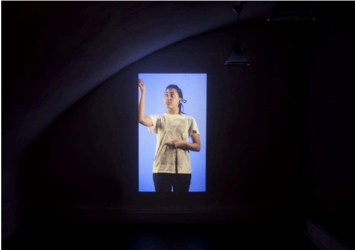
Fíor 4 Ultra-red, RE:ASSEMBLY, Songs for Edgware Road, Installation view at St Marylebone Parish Church, crypt, RE-ASSEMBLY exhibition 2011-2013 (18 Aibreán - 21 Aibreán 2013)