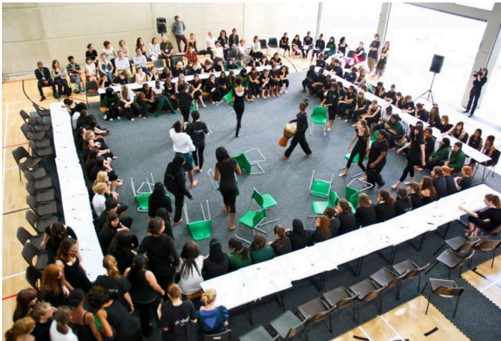
Fíor 3 Ultra-red RE:ASSEMBLY 2009 Civis Sum performance at The St Marylebone Church of England School

fhíricí a cuireadh de ghlanmheabhair a thabhairt chun cuimhne arís. Baintear úsáid as modh na trialach seo, agus na ceisteanna a chuirtear ann, mar shlí chun meas a dhéanamh ar na critéir a chuireann an stát i bhfeidhm chun daoine a chuimsiú nó a eisiáil ón bpróiseas chun a bheith i do shaoránach sa RA. Ceistítear na luachanna nó an réasúnaíocht atá mar bhonn leis an bpróiseas roghnúcháin seo arís trí phlé leantach ina bhféachtar ar dhéscaradh na saoránachta ‘sóisialta’ laethúla i gcomparáid le réaltacht dhlíthiúil na saoránachta ‘stáit’. 10 Seans go léireofaí cosúlachtaí do scoláirí a bhíonn rannpháirteach san fhiosrúchán seo idir an córas oideachais rangaithe agus ordlathach a bhfuil siad mar chuid de, agus an córas saoránachta stáit rangaithe atá eisiach d’aon ghnó, a mbíonn ar imircigh sa RA aghaidh a thabhairt air. Tá creat tógtha ag Ultra-Red chun go ndéanfaidh na scoláirí machnamh ar na rudaí seo iad féin, trí mhodh nach bhfuil teagascach, agus bíodh agus go gcuireann sé treoir ar fáil seans go bhfuil níos mó spáis ann le haghaidh ceisteanna ná mar atá le haghaidh freagraí.