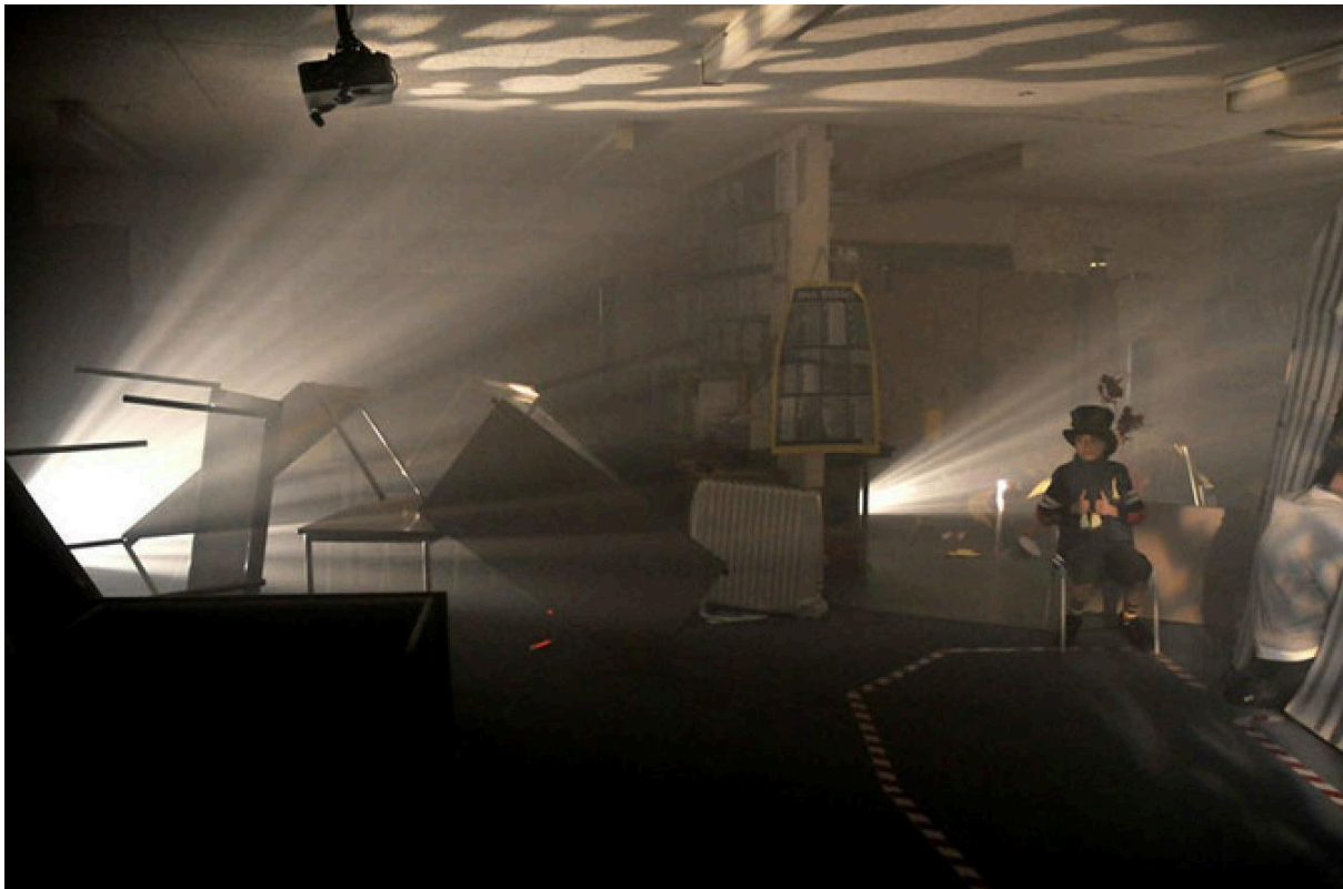
Fíor 5. Nest, ceann de cheithre shuiteán déag don imeacht Promanáide a bhí mar bhuaicphointe le haghaidh tionscadal Nest, 'foscadán aer-ruathair' ina bhféadfadh lucht féachana/éisteachta éisteacht le guthanna páistí 10 mbliana d'aois ag déanamh cur síos ar an uair a bhuaíl 'buama' iad.

tháinig an lucht féachana isteach sa scoil le meon Bhliain 6 (10/11 bliana d'aois) agus gur thaistil siad siar chuig staid an naíonáin trí cheithre shuiteán déag. Tháinig claochlú ar an scoil. Scríobh tuismitheoirí focail le hithir ar urlár an halla, d'athraigh an múinteoir isteach ina Bo Peep agus dhá chaora ina hoifig, bÁCáladh 500 francach aráin agus 'Rat in Mi Kitchen' le UB40 á sheinm agus thosaigh troid sa chófra le haghaidh Taking Stock. Ceapadh gach nead le, le haghaidh nó ag áitritheoirí na scoile, le tacaíocht ó sheachtar ealaíontóirí le leibhéil éagsúla rannpháirtíochta. An treoraí a bhí ann le haghaidh gach promanáide ná páiste (éanbhreathnóir). Thosaigh aistear an lucht féachana agus iad sáite isteach i bhfoscadán aer-ruathair agus iad ag éisteacht le guthanna páistí 10 mbliana d'aois ag déanamh cur cíos ar an uair a bhuaíl buama iad. Bás máthar, féinmharú aintín, cailliúint budragáir, dúnmharú madra, fágáil athar. Nead ciúnais a bhí sa nead deireanach, a ceapadh leis an gceapadóir Jules Maxwell. 14